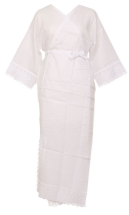
肌着 1式 肌襦袢・裾除け or ワンピース肌着 裾の大きさに着目