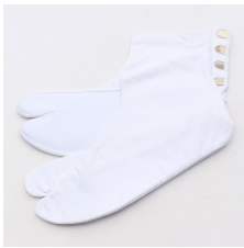
足袋 1式 こはぜのついたもの 絆帯式などお呼ばれなら必ず白、 成人式なら白かおしやれ足袋