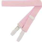
コーリンベルト 2本 用立てないときは 腰ひも2本で代用可