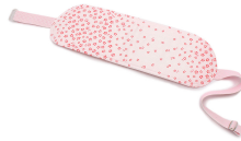
前板(帯板) 1本 長めでしっかりめの材質