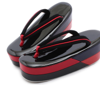
草履 1式 かかと高め、重ね芯のものが◎