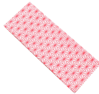
伊達締め 2本 「マジックベルト」でも代用可