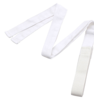
三重仮紐 (トリプル仮紐) 1本