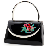
バッグ 1個 小ぶりでも華やかなもの