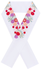
半衿 1枚 襟袷に縫い付ける 裏っ目でもよいが、 刺繍や色地のものが華やかで◎