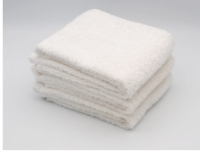
フェイスタオル 5枚 温泉でもらうような薄手のもの 白か淡い色