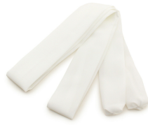
腰ひも 3本 うち1本は「ウエストベルト」でも可